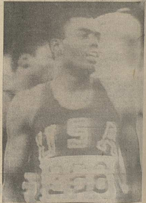
Willie Davenport (USA) gagnant de la finale du 110 m haies.

Soutenu sous les aisselles par son entraîneur, Lee Evans est grimpé péniblement dans le car et s'est effondré les bras en croix sur un fauteuil alors que la voiture démarrait. Lee Evans paraissait sangloter.