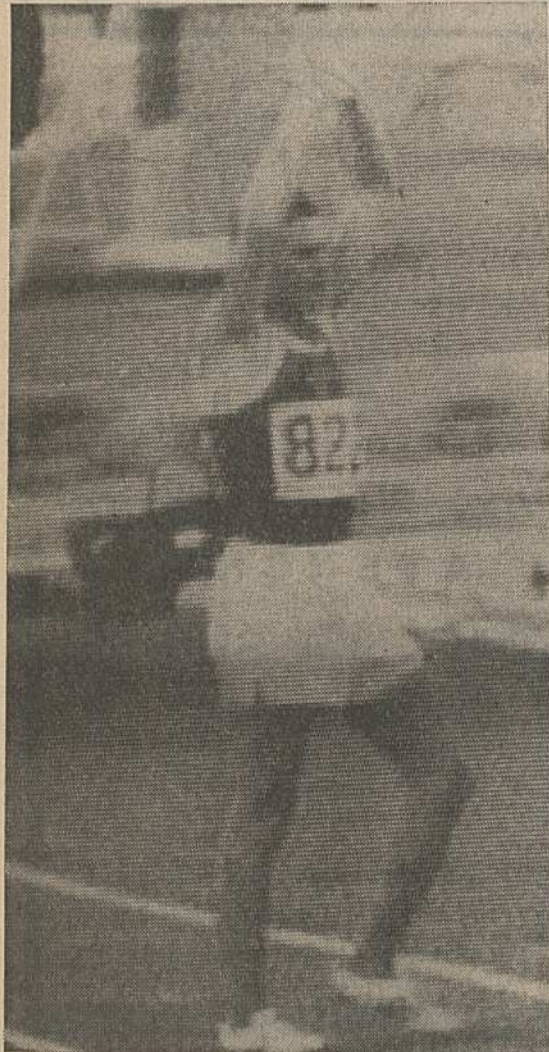
Victor Saneev (URSS) vainqueur du triple saut.

Rebondissement dans l'affaire Smith-Carlos : après des heures de tâtonnements et de délibérations, le comité olympique des Etats-Unis, pressé, croit-on savoir, par M. Avery Brundage et le Comité international olympique, a décidé de suspendre Tommie Smith et John Carlos de l'équipe olympique américaine et de les prier de quitter le village olympique dans les plus brefs délais.